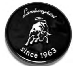
自 1963 年 轮辋徽标