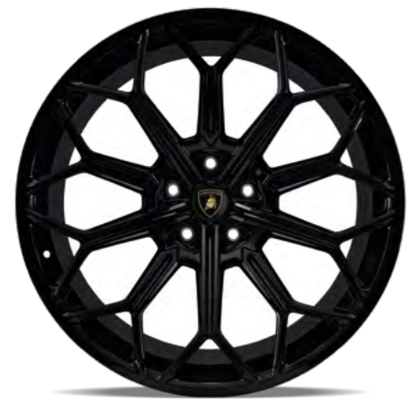
22 英寸 AURIGA

兰博基尼轮辋在圣亚加塔生产厂设计和制造，由一整块铝完美锻造而成。轮辋更轻薄，但强度也丝毫没有减弱。